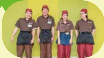
一般就労で働く先輩たち

作業は、秦野地域の業務を中心にしています。 万葉の湯敷敷内に事業所を構え一般就労で働く先輩たちの姿を 見ながら、意識を高め、働く意欲を養う事業所です。